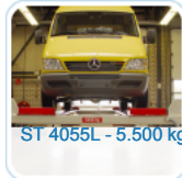
ST 4055L - 5.500 kg