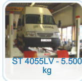
ST 4055LV - 5.500 kg