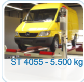
ST 4055 - 5.500 kg